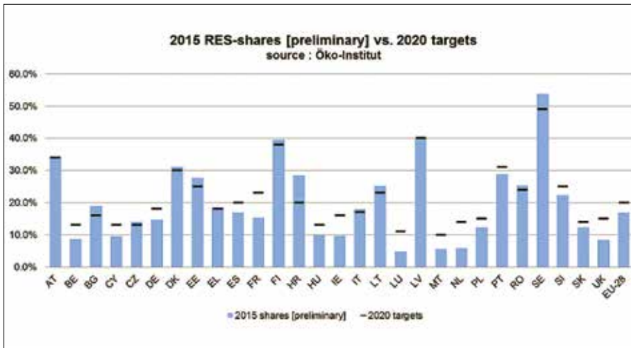
Abbildung 2: Zielvorgaben der EU-Staaten zu ihren nationalen Anteilen regenerativer Energien am Endenergieverbrauch im Jahr 2020 (schwarze Balken) und wie weit diese Ziele bereits im Jahr 2015 erreicht wurden (blaue Balken)

individuell überlassen – allerdings müssen sie dazu alle zwei Jahre einen Erfolgsbericht an die EU-Kommission schreiben.